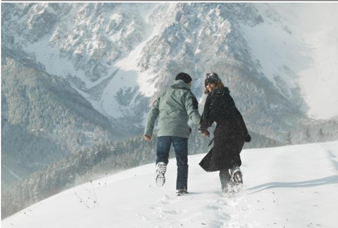
Autor Monika Gschaider Quelle Wiener Alpen in Niederösterreich - Schneeberg Hohe Wand