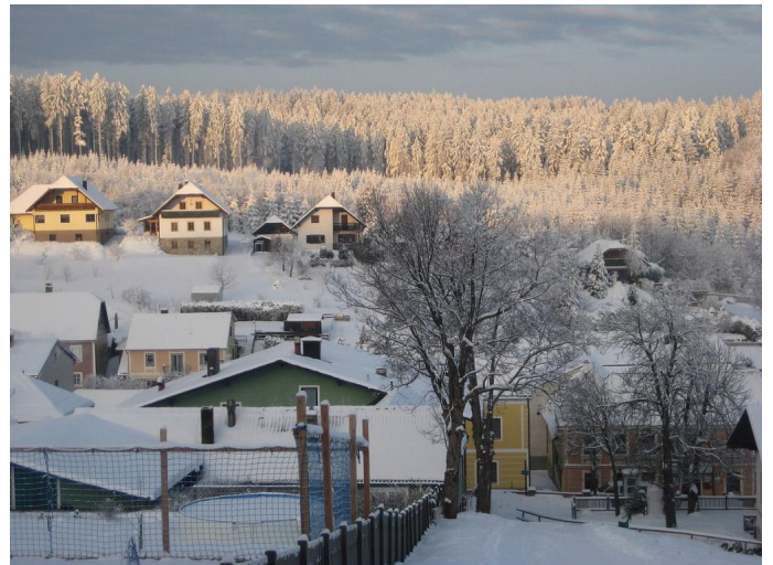
Gutenbrunn Autor Unbekannt Quelle © Gustl Marschall sen.