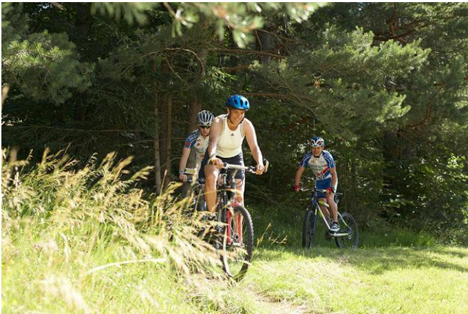
MTB Wiener Alpen