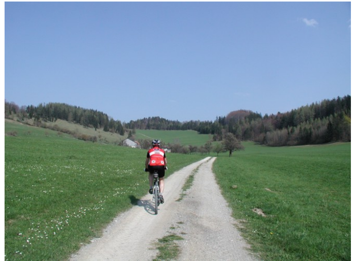
MTB Mostviertel

Poststraße 16 3204 Kirchberg an der Pielach ☎ +43 2722 7314