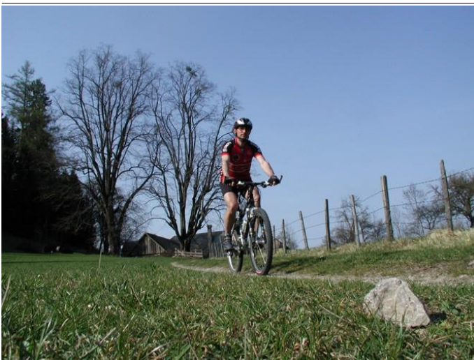
MTB Mostviertel Autor Unbekannt Quelle Mostviertel Tourismus GmbH