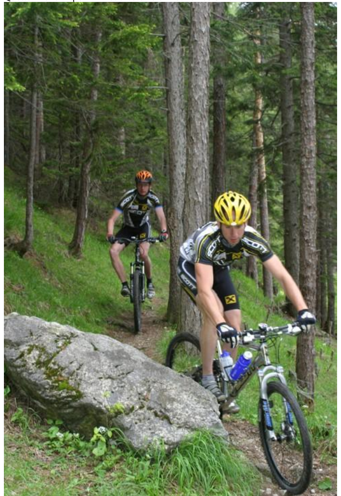
MTB Wiener Alpen in NÖ