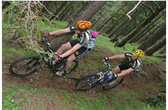
MTB Wiener Alpen in NÖ