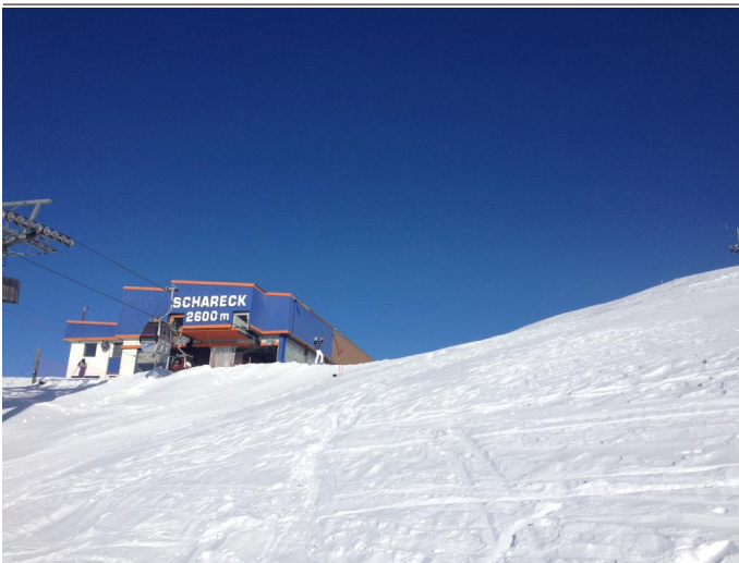
kürzester Anstieg - beste Aussicht: Von der Bergstation erreicht man in wenigen Minuten den Schareck-Gipfel Autor Andreas Kleinwächter Quelle Kärnten Hohe Tauern