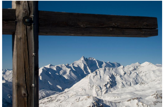
Autor Unbekannt Quelle Kärnten Hohe Tauern