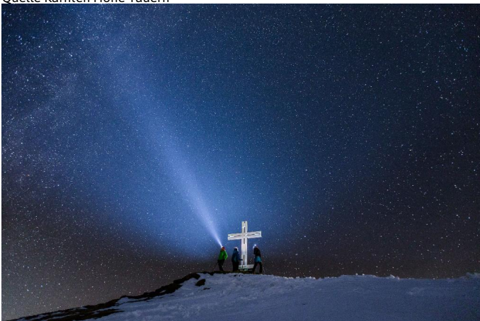
Autor Unbekannt Quelle Kärnten Hohe Tauern