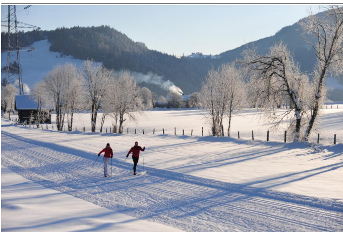
Cross-country skiing near Mandling