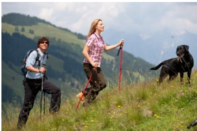
Autor Stephanie Schuster Quelle Hochkönig Tourismus GmbH