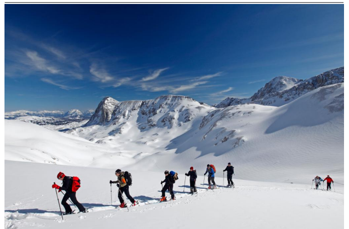
Skitouren am Dachstein Gletscher

Autor Tourismusverband Ramsau am Dachstein