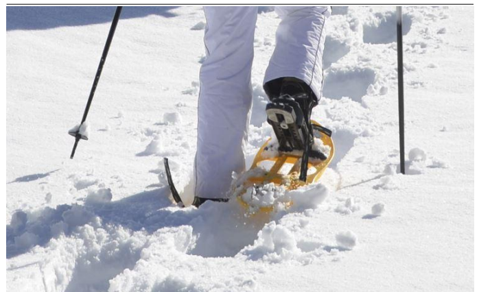
Autor Tourismusverband Lesachtal Quelle TVB Lesachtal