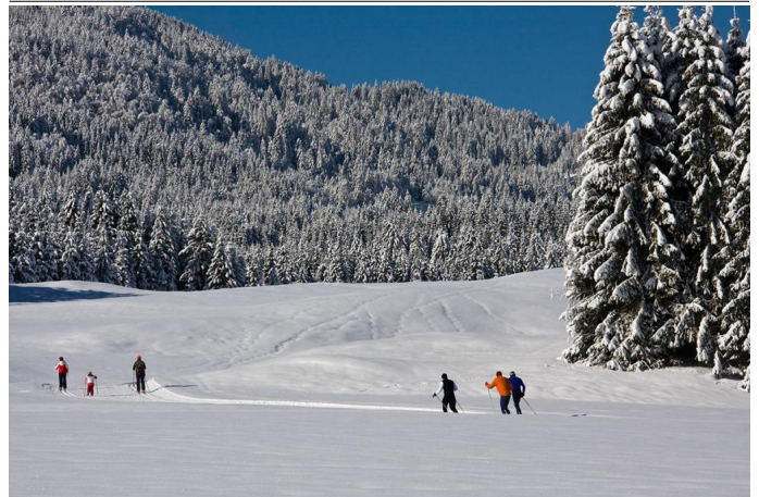
Autor Tourismusinfo Nassfeld-Pressegger See Quelle Weissensee Information