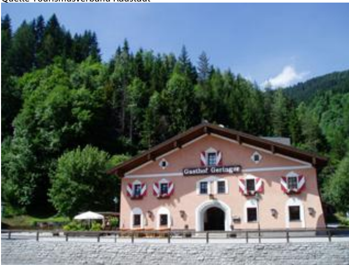
Gasthof Geringer Autor Unbekannt Quelle Tourismusverband Radstadt