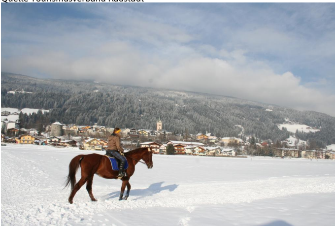
Pferd Autor Unbekannt Quelle Tourismusverband Radstadt