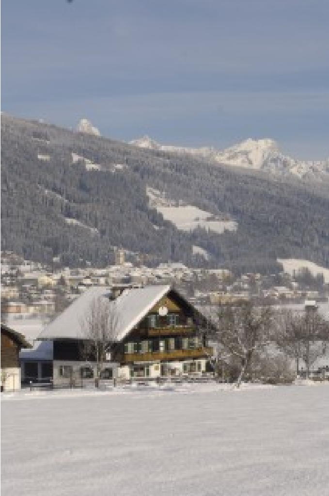
Wirtshaus zum Kaswurm