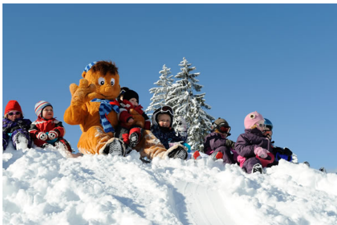
Wagrains Winterwelt