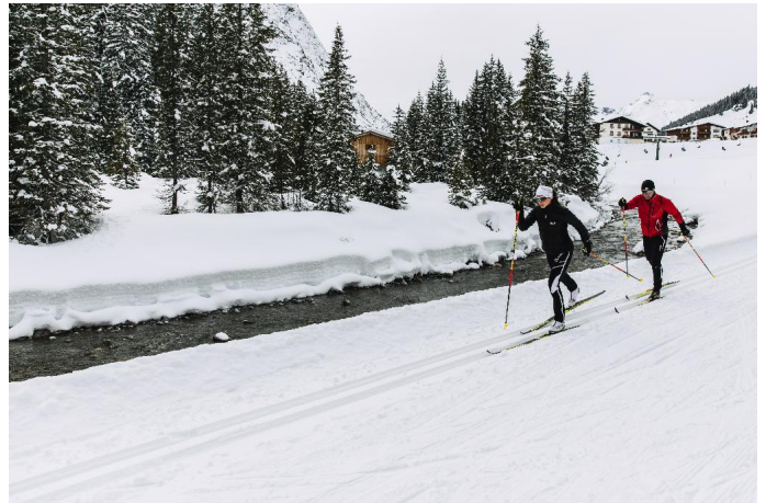
Omesberg - Zug - Omesberg