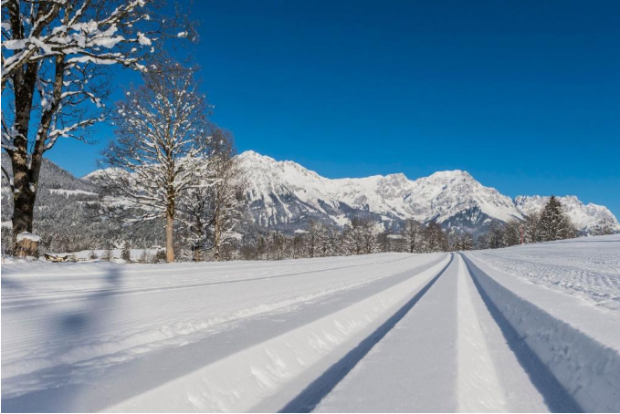
Schattseitloipe_Soell_Foto Martin Raffeiner (4).jpg Autor Tourismusverband Wilder Kaiser Quelle Tourismusverband Wilder Kaiser