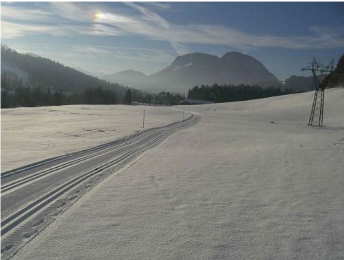
Verbindung Scheffau - Ellmau 2 Autor TVB Wilder Kaiser Quelle TVB Wilder Kaiser