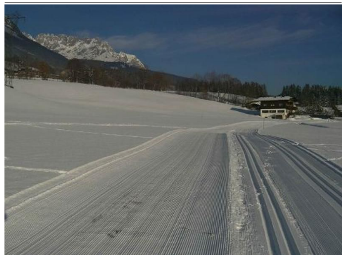
Verbindung Scheffau - Ellmau Autor TVB Wilder Kaiser Quelle TVB Wilder Kaiser