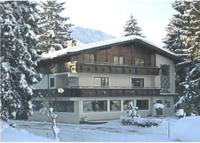
Gasthof Föhrenhof im Winter