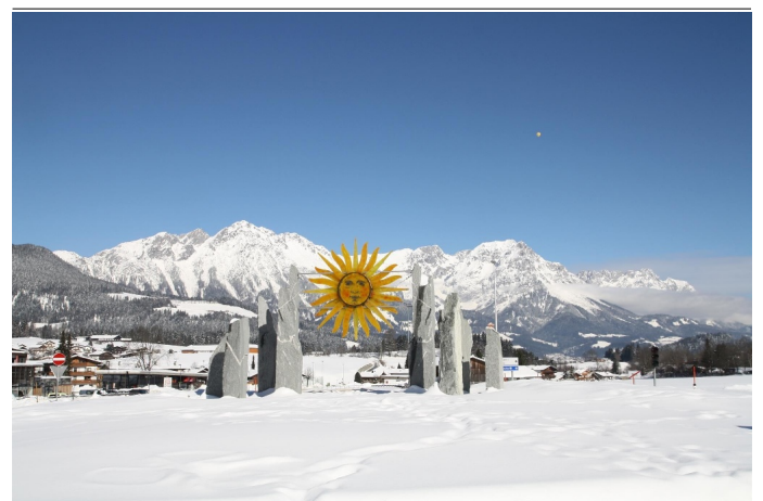
Kreisverkehr Soeller Sonne_Soell_Foto TVB Wilder K Autor Tourismusverband Wilder Kaiser Quelle Unbekannt