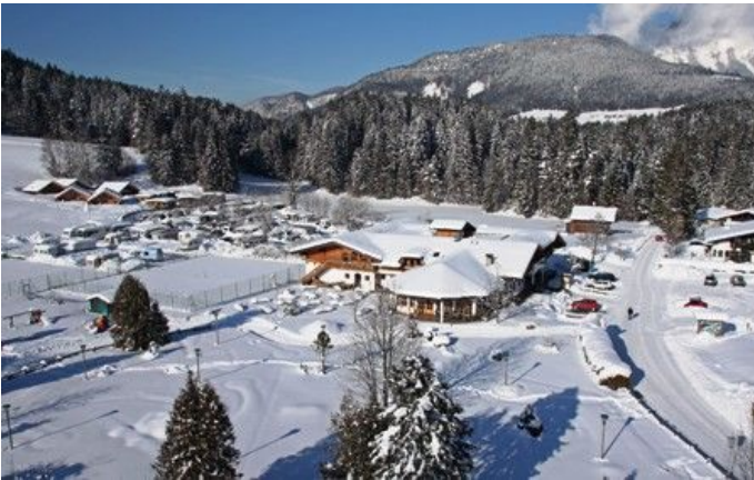
Franzlhof Winter