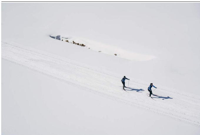
Autor Unbekannt Quelle Ötztal Tourismus