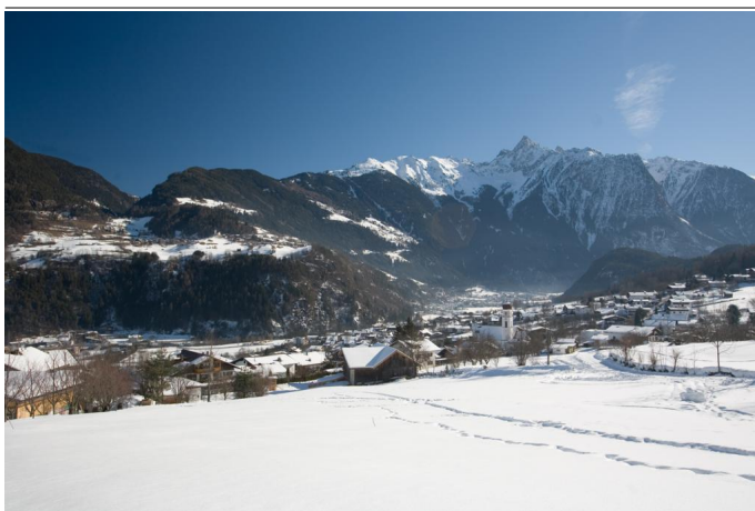
Winterwandern in Sautens Autor Unbekannt Quelle Ötztal Tourismus