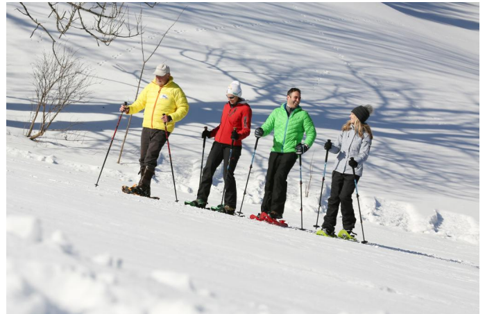
Schneeschuhwandern in Lackenhof