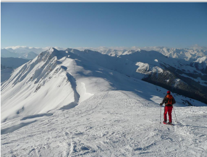
Stemmerkogel Autor Hans Eder Quelle Saalbach Hinterglemm