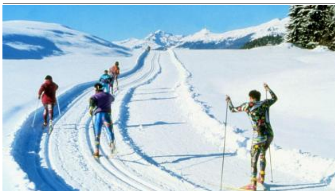
Autor Nassfeld - Pressegger See