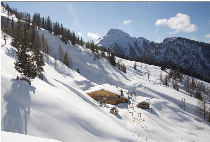
Die Loosbühelalm im Winter