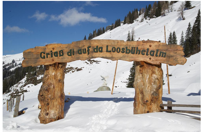
Griaß di auf der Loosbühelalm Autor Unbekannt

Quelle Tourismusverband Großarltal - Ferienregion Nationalpark Hohe Tauern