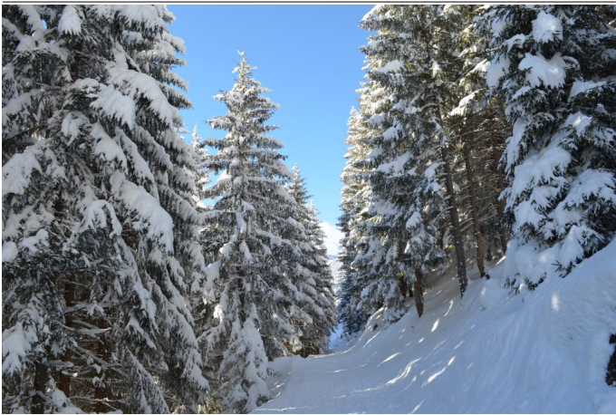
verschneite Winterlandschaft