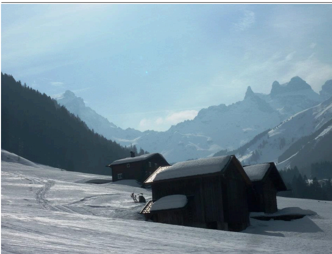
Gauertal mit den Drei Türmen Autor Christina Wachter Quelle BergAktiv Monika Vonier