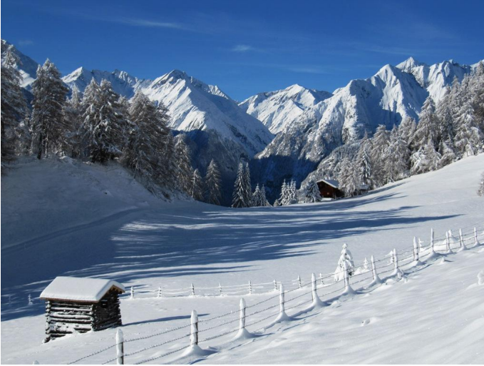
Autor Bernhard Pichler Quelle Österreichs Wanderdörfer