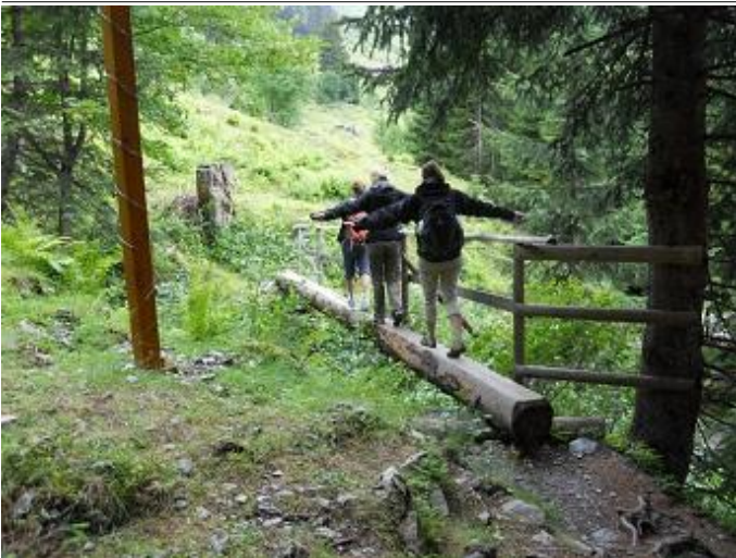
Wanderlehrpfad Autor TVB Saalbach Hinterglemm Quelle Saalbach Hinterglemm