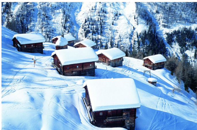
Autor Bernhard Pichler Quelle Österreichs Wanderdörfer