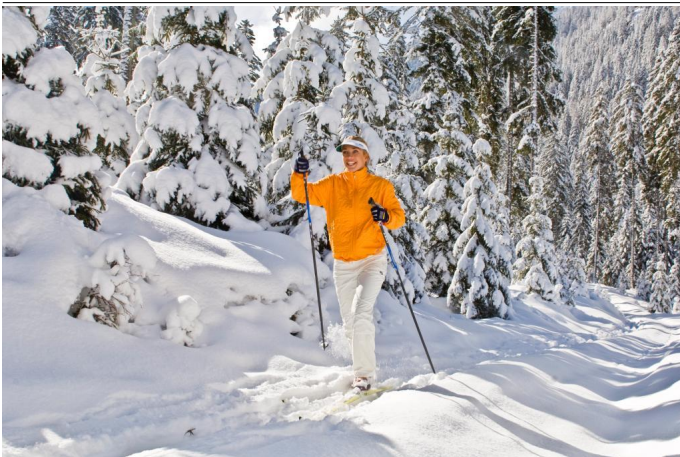
Langlaufen in Altenmarkt-Zauchensee