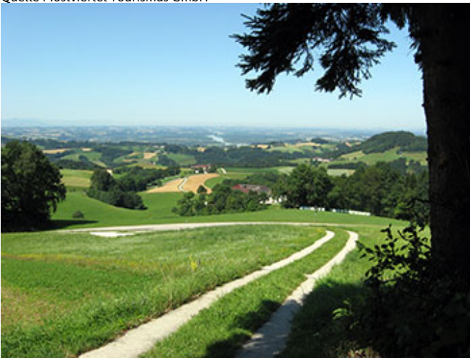
Autor Unbekannt Quelle Mostviertel Tourismus GmbH