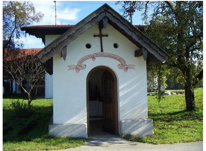
Autor Unbekannt Quelle Alpstein