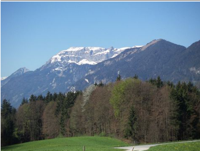
Autor Unbekannt Quelle Alpstein