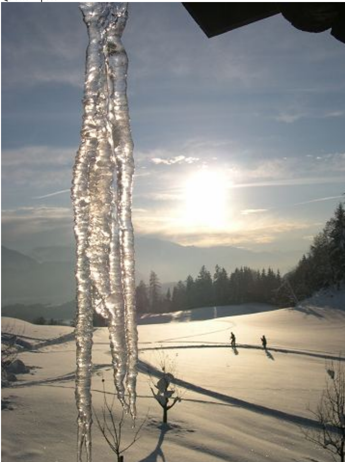
Autor Unbekannt Quelle Alpstein