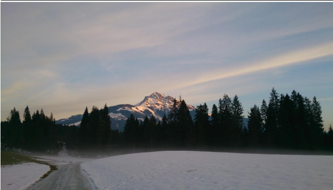
Lindernweg Autor Kitzbüheler Alpen St. Johann Quelle Österreichs Wanderdörfer