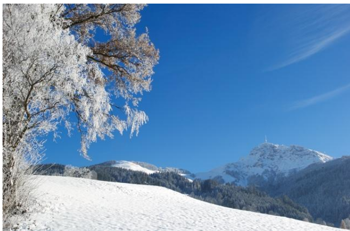
Oberndorf Winter Autor Kitzbüheler Alpen St. Johann Quelle Oberndorf Winter