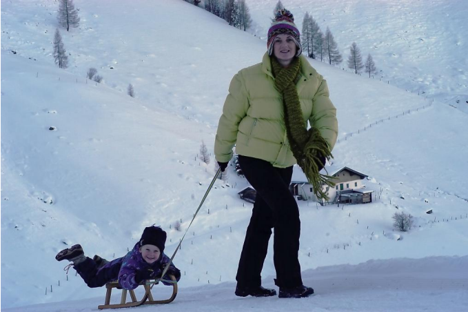
Winterwanderweg Zillstatt - Streuböden