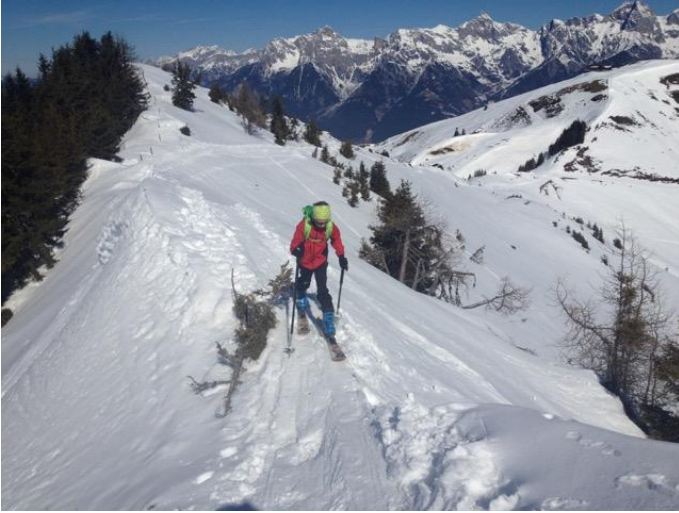
Hundstein_Skitour_4 Autor Stephanie Schuster Quelle Markus Hirnböck