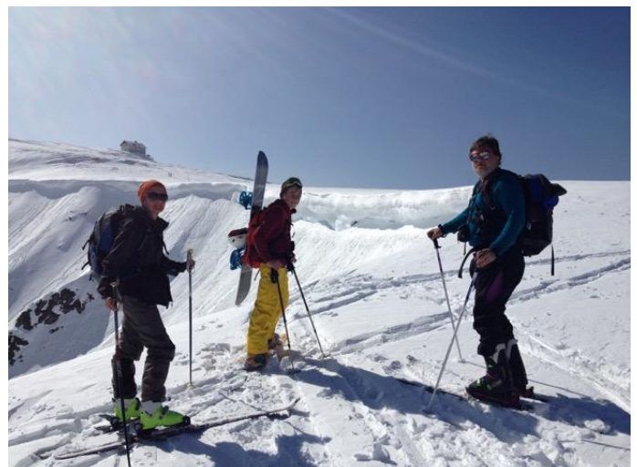
Hundstein_Skitour_3 Autor Stephanie Schuster Quelle Markus Hirnböck