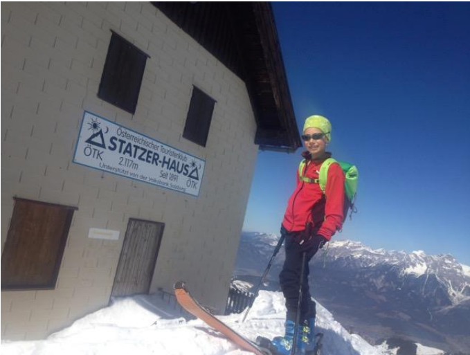
Hundstein_Skitour_5 Autor Stephanie Schuster Quelle Markus Hirnböck