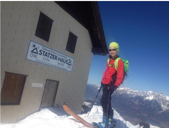
Hundstein_Skitour_5 Autor Stephanie Schuster Quelle Markus Hirnböck