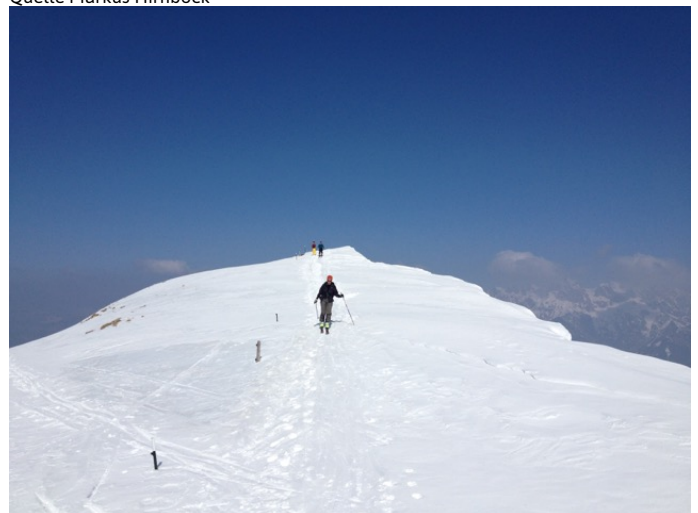
Hundstein_Skitour_2 Autor Stephanie Schuster Quelle Markus Hirnböck