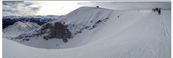
Hundstein_Skitour Autor Stephanie Schuster Quelle Markus Hirnböck