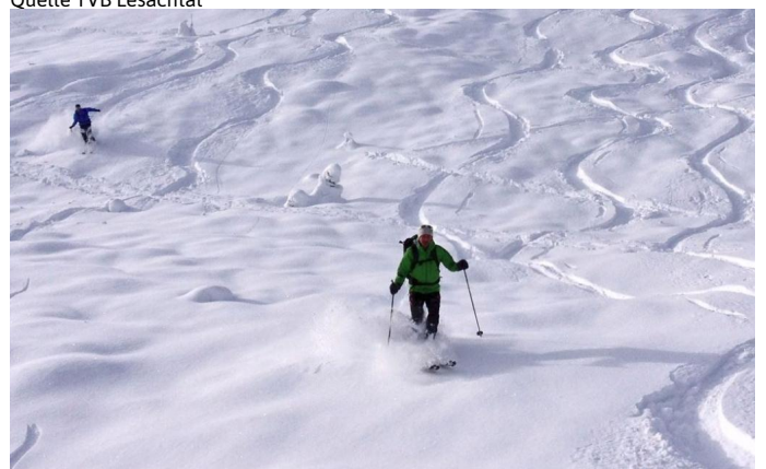
Autor Alexander Lugger Quelle Alexander Lugger