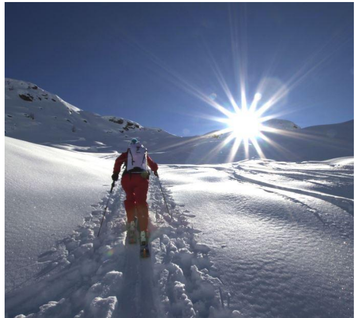
Autor Tourismusverband Lesachtal Quelle TVB Lesachtal