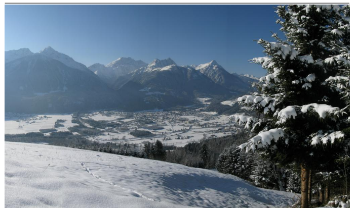
Panorama Kötschach-Mauthen Autor Tourismusinfo Nassfeld-Presseegger See Quelle Harald Salcher