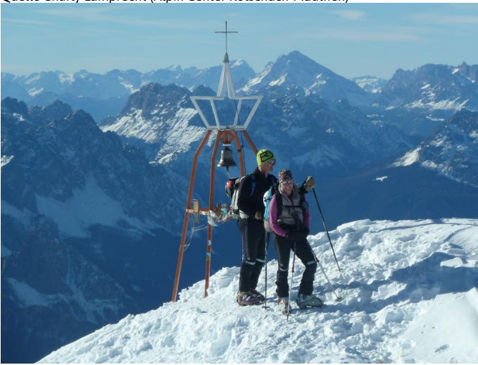
Am Gipfel der Hohen Warte