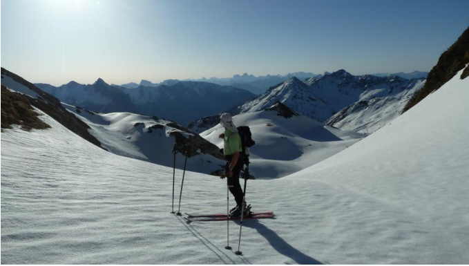
Hänge der Hohen Warte