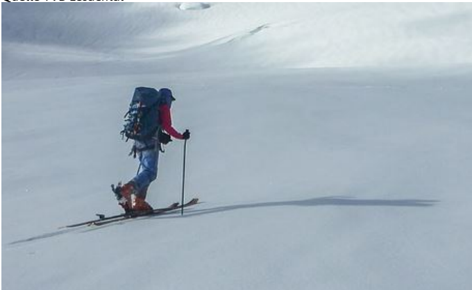
Autor www.pixabay.com Quelle www.pixabay.com